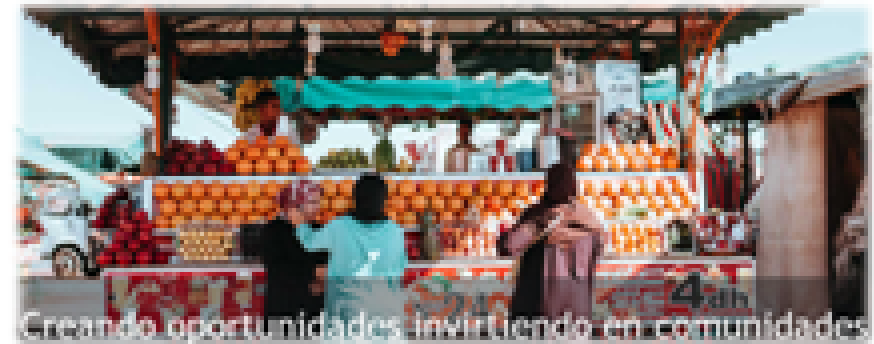
Creando oportunidades invirtiendo en comunidades

DISASTER NETWORK of ASSISTANCE | ROTARY ACTION GROUP Disaster Response: We Connect the Dots