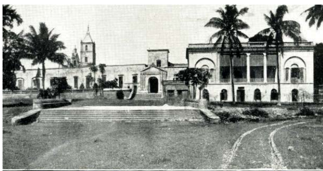
The Augustinian Church and Convent of Bandel, Hooghly, Bengal. Founded in 1599.