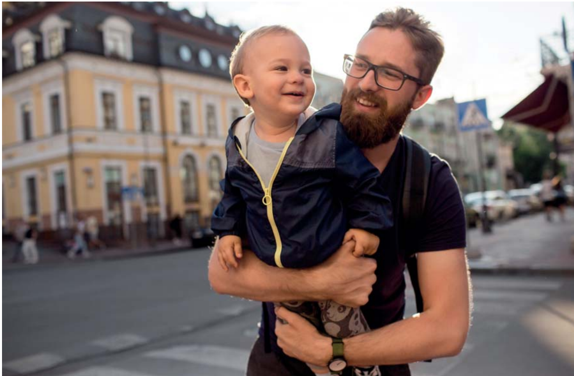
Un padre y su hijo comparten un momento feliz en Kiev.