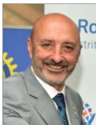
Manuel Menéndez Governador del Distrito 2201