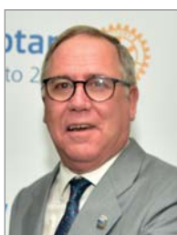
Javier Ygarza Governador del Distrito 2203

Caminamos ya hacia el fin de nuestro año rotario y casi notamos la urgencia de terminar proyectos iniciados y un pequeño temor de no poder concluirlos. Pero este temor desaparece cuando nos damos cuenta de que no estamos solos en este caminar. Nace nuestro optimismo de la gozosa experiencia de nuestro contacto con los clubes, pulsando la vitalidad y el esfuerzo realizado por reponerse de las adversas situaciones creadas por la pandemia.