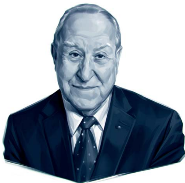
Ilustración de Viktor Miller Gausa