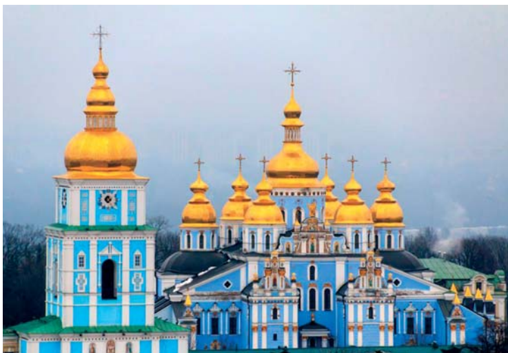
El Monasterio de San Miguel de las Cúpulas Doradas es la sede de la Iglesia Ortodoxa de Ucrania.

Dada nuestra experiencia del conflicto en el este de Ucrania, hemos hecho de la construcción de la paz y la prevención de conflictos un enfoque principal de nuestros proyectos comunitarios. Uno de estos proyectos, en marcha desde 2017, ofrece formación a diversos grupos para promover el diálogo hacia la reconciliación en múltiples niveles de la sociedad ucraniana. Además, durante los últimos cinco años, los miembros del club han participado en un gran proyecto internacional para la rehabilitación psicológica de los niños afectados por la guerra y el conflicto militar en el este.