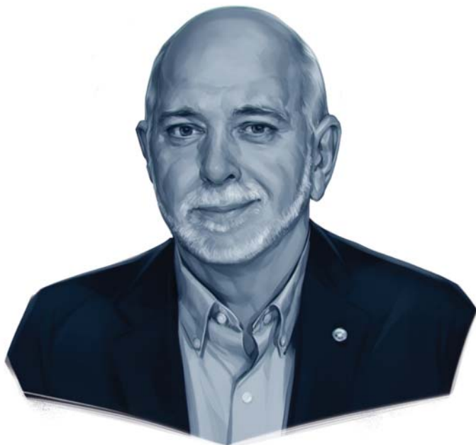
Ilustración de Viktor Miller Gausa