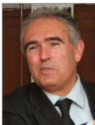
Raül Font-Quer Plana Gobernador del Distrito 2202