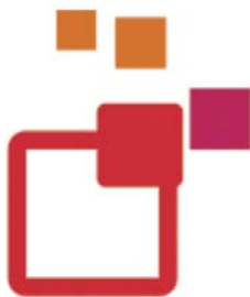
Associació d'Igualada per a la UNESCO

Este fin de semana, el Centro Cívico Norte de Igualada ha sido escenario de la tercera edición del RYLA (Rotary Youth Leadership Awards) con el lema "La Ruta de la Pau".