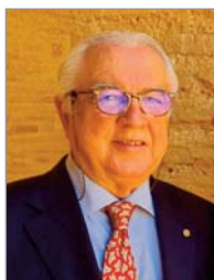
Dimas Rizzo Gobernador del Distrito 2203