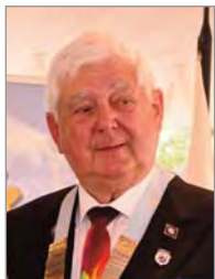
José Ibáñez Climent Gobernador del Distrito 2203