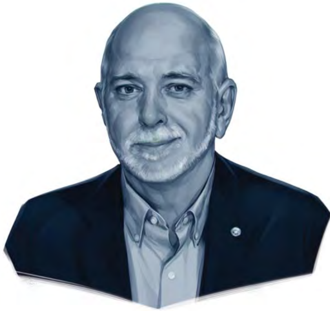
Ilustración de Viktor Miller Gausa