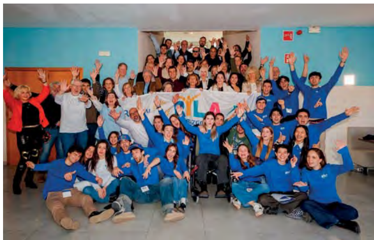
Ryla zona 1 (Balears)

Hasta la fecha, y durante el presente ejercicio rotario, el Distrito 2203 ha organizado los cuatro programas RYLA (Rotary Youth Leadership Awards) a nivel zonal, fortaleciendo el compromiso con el desarrollo del liderazgo entre los jóvenes.