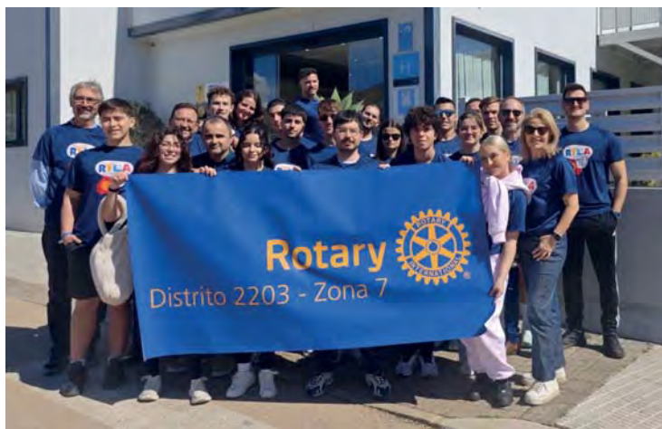
Ryla zona 7 (Murcia)

Por último, y hasta la fecha, se ha organizado el veterano RYLA de la Zona 3, celebrado en la ciudad de Cullera. Al igual