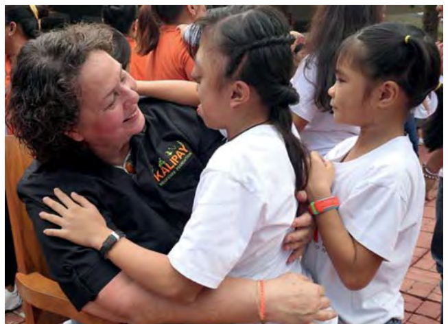
Niñas rescatadas, abusadas sexualmente, en Isla Negros, Filipinas, en la Fubdscion Kalipay

La oficialización del Grupo de Acción Rotaria para el Empoderamiento de las Niñas no es solo un hito institucional, sino también un impulso para seguir promoviendo proyectos transformadores que cambien vidas. Con liderazgo, compromiso y una mirada global, desde Rotary demostramos, una vez más, que nuestra vocación de servicio también significa defender los derechos de las niñas y abrirlas camino hacia un futuro más justo y equitativo.