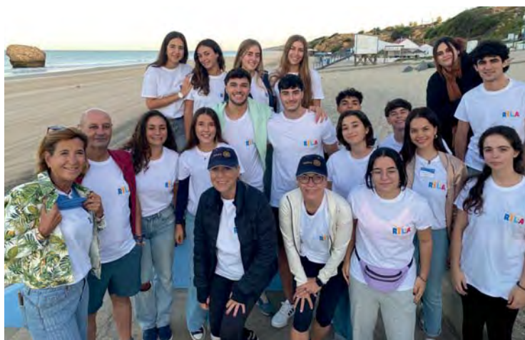
Ryla zona 10 (Matalascañas)