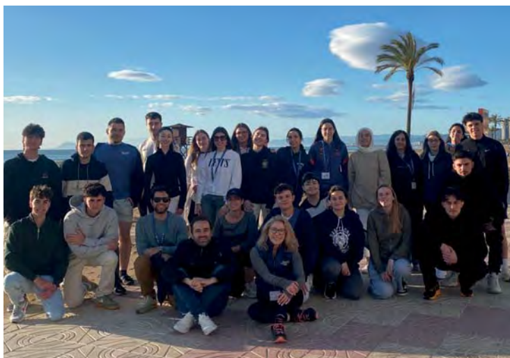
Ryla zona 3 (Valencia)

que los anteriores, este encuentro tuvo lugar en primera línea de playa, aprovechando el entorno para fomentar las actividades al aire libre. Participaron 26 jóvenes de entre 18 y 26 años, quienes disfrutaron de ponencias formativas, actividades náuticas y dinámicas deportivas en un ambiente de compañerismo y desarrollo per-